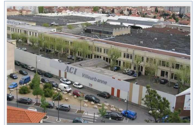
Site de Villeurbanne

J'informe mon N+1, qui informe le service médical de mon site Le service de santé au travail détermine la conduite à tenir ultérieure pour le malade et l'entourage professionnel