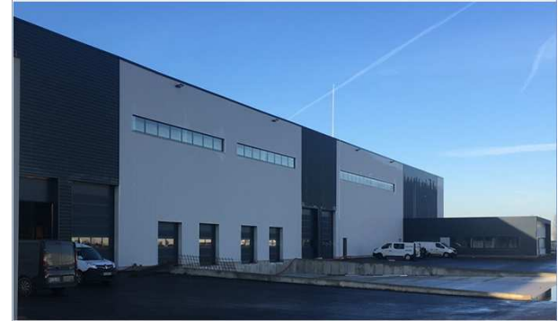
Site de Meyzieu